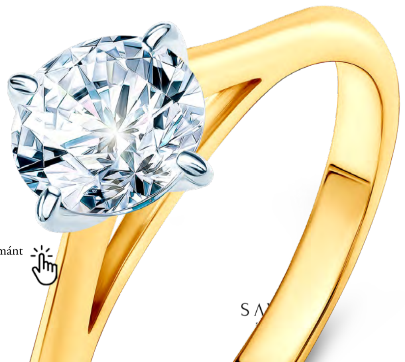
The Light eljegyzési gyűrű: kétszínű arany és gyémánt

Acest scenariu unic va fi completat perfect de un inel de logodnă elegant SAVICKI din colecția The Light .