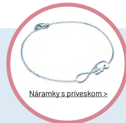
Náramky s prívieskom >