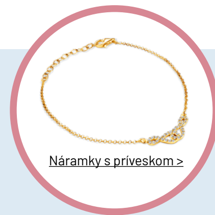
Náramky s príveskom >